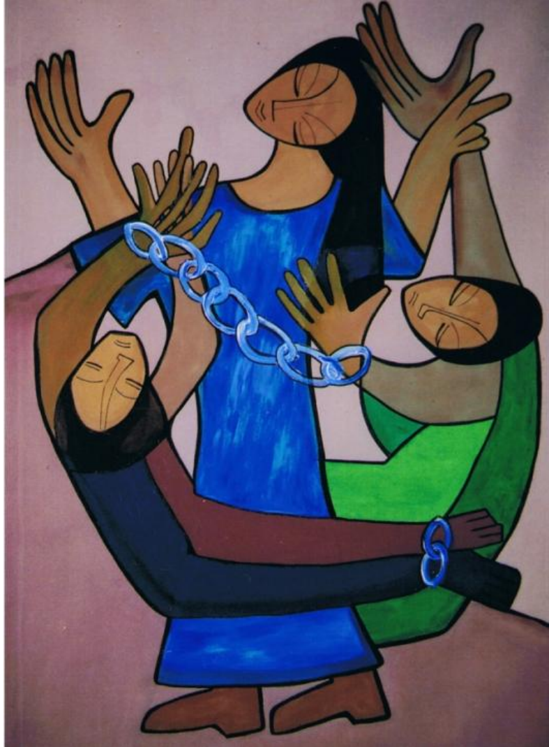
Illustration: Sr. Ludwina Foolen sfc