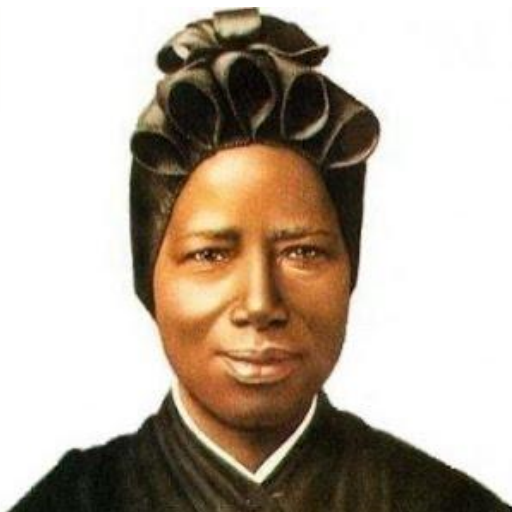
Hl. Josephine Bakhita